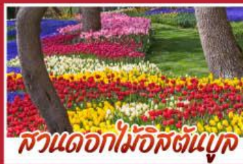
สวนดอกไม้อิสตันบูล