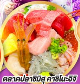
ตลาดปลาฮิมิสึ คาชิโนะอิชิ