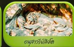
อนุสาวรีย์สิงโต