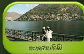
ทะเลสาบโคโป