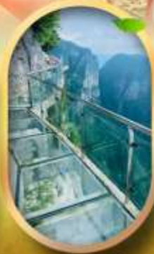
ทางเดินกระจกฉิมผา