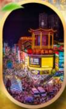
ถนนคนเดินชิงสู