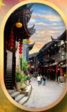
เมืองโบราณฟูหลงเจิ้น