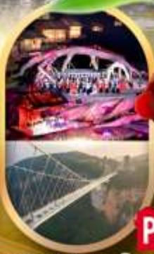
OPTION 1: ไร่บางพรางจึงจอกขาว OPTION 2: สะพานแก้วจางเจียเจีย