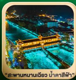
“สะพานหนานเฉียว น้ำคาสีฟ้า”

วันเดินทาง 4 วัน | 3 คืน มี.ค. - มี.ย. 2569