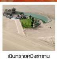
เขื่อนทรายหมิงซาซาน