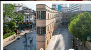
ถนนเก่าคุณหมิง