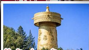
วัดต้าฝอ กงล้อมณฑล