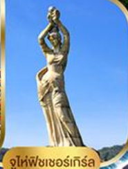
จูไห่ฟิชชอร์ทรีซ่า