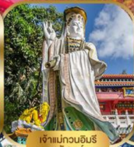
เจ้าแม่กวนอิม พลัสสมัย