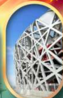
ผ่านชมสนามกีฬาโอลิมปิก