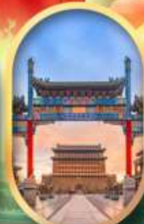
ถนนคนเดินเทียนเหมิน