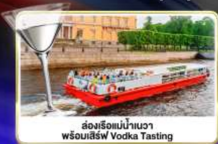
ล่องเรือแม่น้ำแคว พร้อมเสิร์ฟ Vodka Tasting