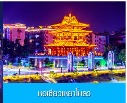
หอชิวเหยาไหล