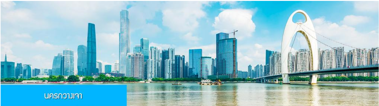
นครกวางเจา

21.00 น. คณะเดินทางพร้อมกันที่ ท่าอากาศยานสุวรรณภูมิ อาคารผู้โดยสารขาออกระหว่างประเทศ ชั้น 4 ประตู 10 เคาน์เตอร์เช็คอิน สายการบิน 9AIR (AQ) โดยมีเจ้าหน้าที่บริษัทฯ คอยให้การต้อนรับและอำนวยความสะดวกในการเช็คอิน