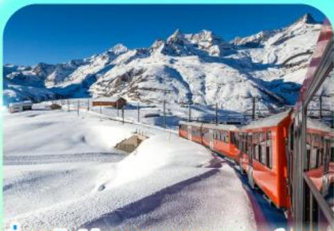
นั่งรถไฟสู่ยอดเขารอนเนอ์เกรต