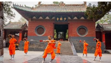
ชมโชว์กังฟูเล่าหลิน

*ทางบริษัทฯ ขอสงวนสิทธิ์ในการสลับโปรแกรมทัวร์ตามความเหมาะสมขึ้นอยู่กับสถานการณ์หน้างาน โดยคำนึงถึงผลประโยชน์ของลูกค้าเป็นสำคัญ