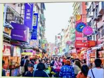
ถนนโบราณต๋นส่วย