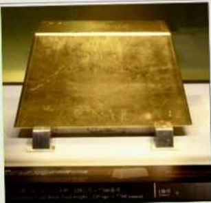
พิพิธภัณฑ์ทองคำ