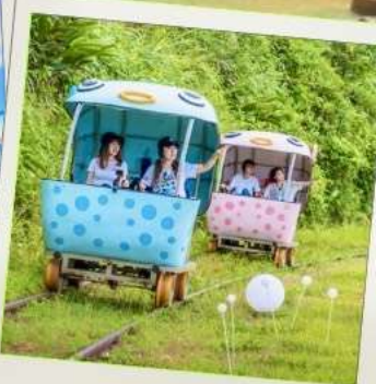
Shen'ao Rail Bike