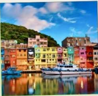
ท่าเรือเจิ้งปิง