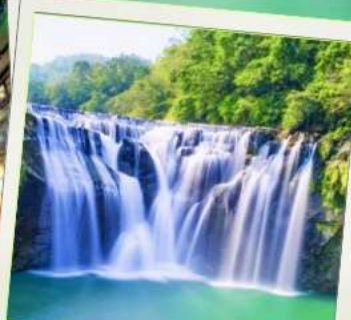
น้ำตกสีส้ม