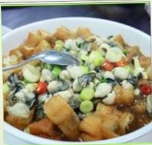
ถนนโบราณสีส้ม