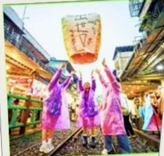
ปล่อยโคมลอย