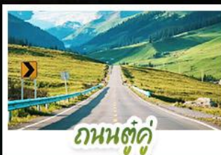
ถนนสู่คู่