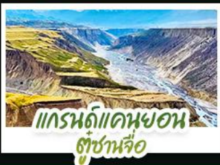
แกรนด์แคนยอน ซูซงหือ

ปล่อยใจให้ล่องลอยไปกับสายลมเย็นบนที่ราบสูง...ในดินแดนที่ความโรแมนติก เนืองน่านท่ามกลางทุ่งหญ้าและหิมะ สัมผัสความเขียวขจีของ "ทุ่งหญ้านาสาทิ" และ "ทุ่งหญ้าคาลาจัม" ที่ได้รับการยกย่องว่าเป็นทุ่งหญ้าที่สวยงามแห่งหนึ่งของโลก ชมความใสสะอาดของ "ทะเลสาบโซ่หิมะ" น้ำตาดหายสุดท้าย ของมหาสมุทรแอตแลนติก ที่สะท้อนเงาขุนเขาหิมะอย่างงดงาม