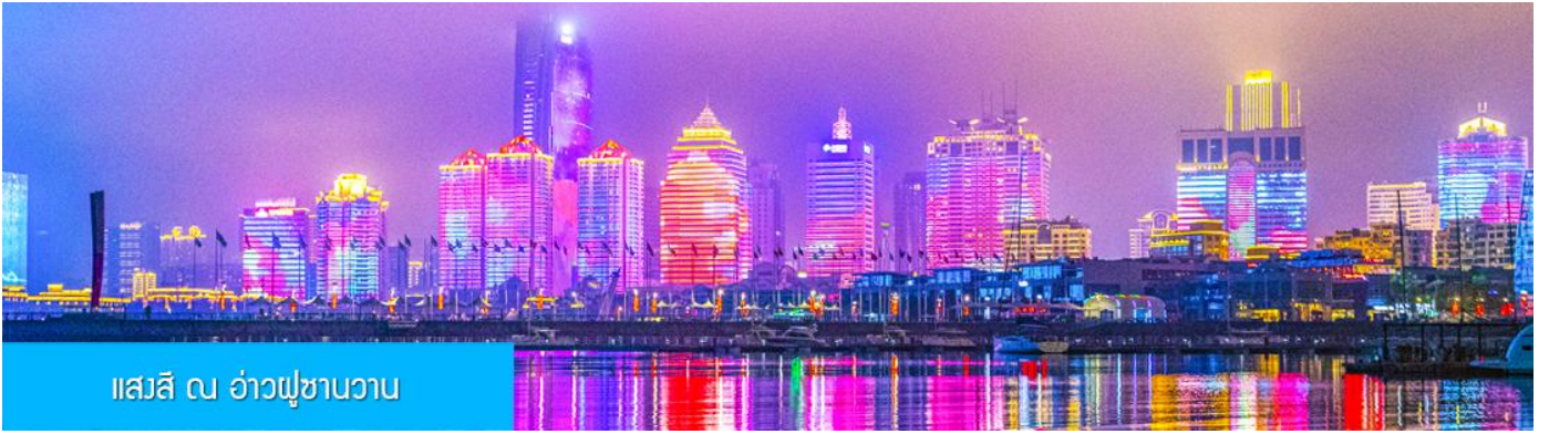
แสงสี ณ อ่าวฟูซานวาน