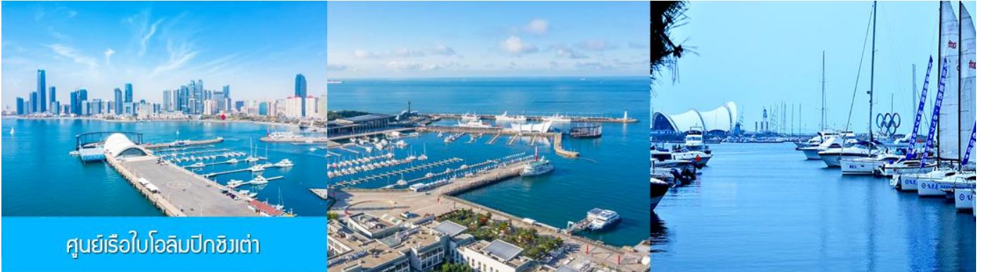
ศูนย์เรือใบโอลิมปิกชิงเต่า

จากนั้นนำท่านเที่ยวชม โรงเบียร์ชิงเต่า 青岛啤酒博物馆 พิพิธภัณฑ์เบียร์ที่ขึ้นชื่อของเมืองชิงเต่า ซึ่งเป็นเบียร์ยี่ห้อแรกที่ผลิตขึ้นในประเทศจีน ชมเบียร์ คอลเลกชันที่มียี่ห้อหลากหลายที่สุดของโลก และชมการจัดแสดงภาพและวิทัศน์เกี่ยวกับวิวัฒนาการของเบียร์ ขั้นตอนการผลิตและอื่น ๆ ที่เกี่ยวข้อง พร้อมชิมเบียร์ชิงเต่า ซึ่งเป็นเบียร์ที่ขายดีที่สุดยี่ห้อหนึ่งของจีน.. (ชิมเบียร์ชิงเต่าท่านละ 1 แก้ว รับประทานอีก 1 ขวดเล็ก ตอนเดินออก)