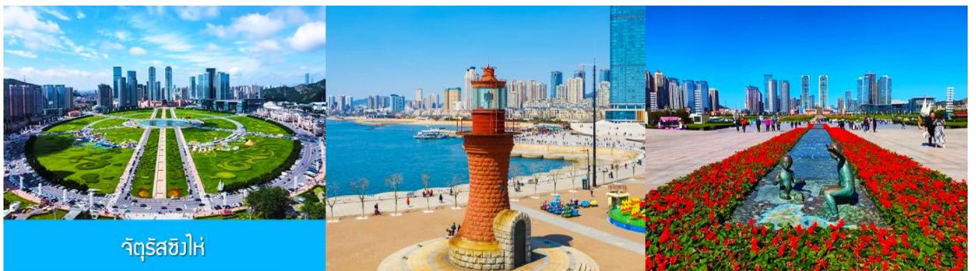
จัตุรัสซีไห่

จากนั้นนำท่านเที่ยวชมและเก็บภาพ ณ พิพิธภัณฑ์ประวัติศาสตร์หลี่ซุ่น 旅顺博物馆 เป็นอาคารพิพิธภัณฑ์เก่าแก่อายุกว่าร้อยปีแห่งแรกที่สร้างขึ้นทางภาคตะวันออกเฉียงเหนือของจีน อาคารพิพิธภัณฑ์มีความโดดเด่นด้วยสถาปัตยกรรมแบบกรีกโรมันยุคเรเนซองส์ ผสมผสานสถาปัตยกรรมแบบตะวันออก ภายในมีการจัดแสดงโบราณวัตถุกว่า 60,000 ชิ้น ท่านสามารถเก็บภาพที่ระลึกด้านหน้าอาคารพิพิธภัณฑ์ และสามารถเข้าชมโบราณวัตถุภายในพิพิธภัณฑ์ได้ตามอัธยาศัย (พิพิธภัณฑ์ปิดทุกวันจันทร์)..