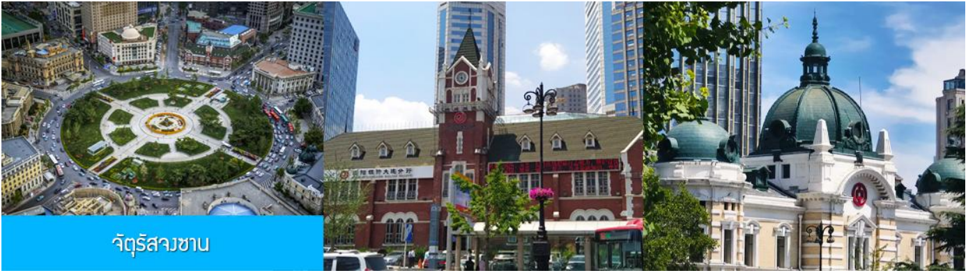
จัตุรัสสวนซาน