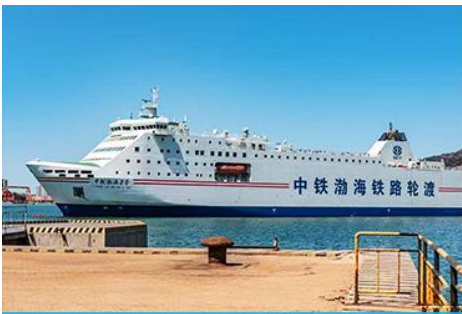
เรือ ZHONGTIE BOHAI CRUISE