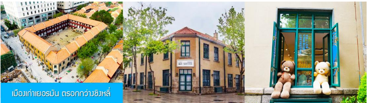
เมืองเก่าเยอรมัน ตรอกกว้างชิงหลี่

จากนั้นนำท่านเดินเที่ยวชม ถนนจงชาน 中山路 ถนนที่เต็มไปด้วยกลิ่นอายยุโรป และถนนสายนี้มีบันทึกเรื่องราวมากกว่าศตวรรษของเมืองชิงเต่าไว้ ที่นี่เป็นศูนย์กลางการค้าแห่งแรกที่เต็มไปด้วยสถาปัตยกรรมสไตล์ยุโรปเก่าแก่ที่ได้รับอิทธิพลมาจากเยอรมัน ให้ท่านได้เดินเก็บบรรยากาศ และ เก็บภาพกับ โบสถ์เซนต์ไมเคิล (ด้านนอก) โบสถ์แห่งนี้ที่คู่รักนิยมมาถ่ายภาพงานแต่งงานด้วยกันมากที่สุดในเมืองชิงเต่า ให้ท่านถ่ายรูปเก็บภาพ