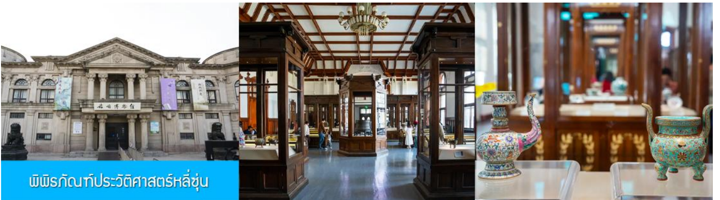
พิพิธภัณฑ์ประวัติศาสตร์หลี่ซุ่น

นำท่านเที่ยวชมและเก็บภาพ ณ สถานีรถไฟหลี่ซุ่น 旅顺火车站 เป็นสถานีปลายทางของเส้นทางรถไฟสาขา เลิ่นหยาง - ต้าเหลียน สร้างขึ้นในปีค.ศ. 1903 ออกแบบโดยสถาปนิกชาวรัสเซีย เป็นอาคารอิฐก่อปูนผสม โครงสร้างไม่ตามสถาปัตยกรรมรัสเซีย.