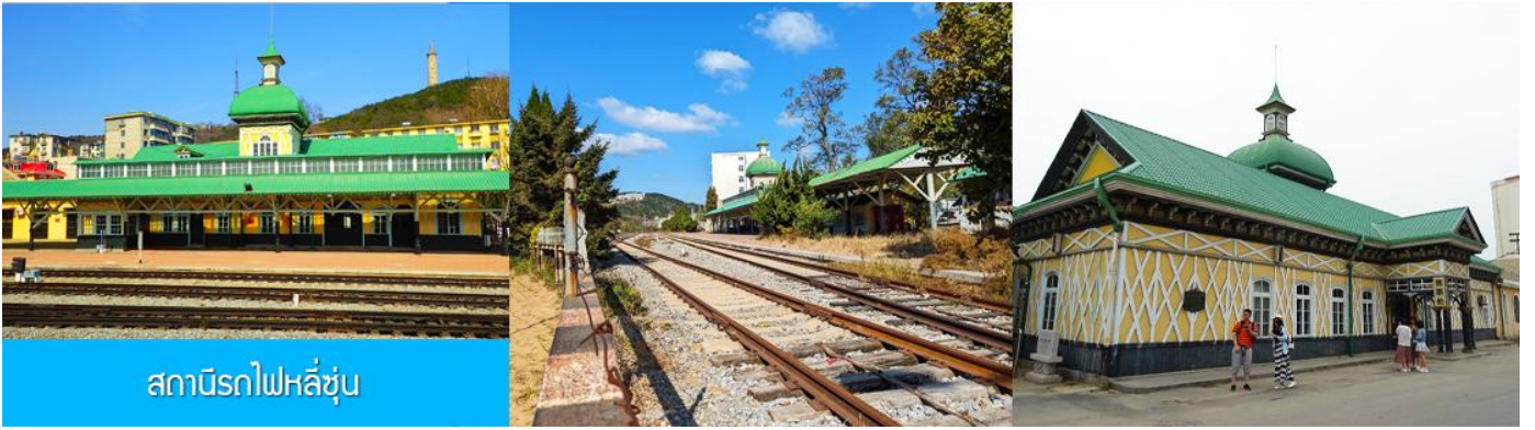
สถานีรถไฟหลี่ซุ่น

นำท่านเที่ยวชมและเก็บภาพ ณ สถานีรถไฟหลี่ซุ่น 旅顺火车站 เป็นสถานีปลายทางของเส้นทางรถไฟสาขา เลิ่นหยาง - ต้าเหลียน สร้างขึ้นในปีค.ศ. 1903 ออกแบบโดยสถาปนิกชาวรัสเซีย เป็นอาคารอิฐก่อปูนผสม โครงสร้างไม่ตามสถาปัตยกรรมรัสเซีย.