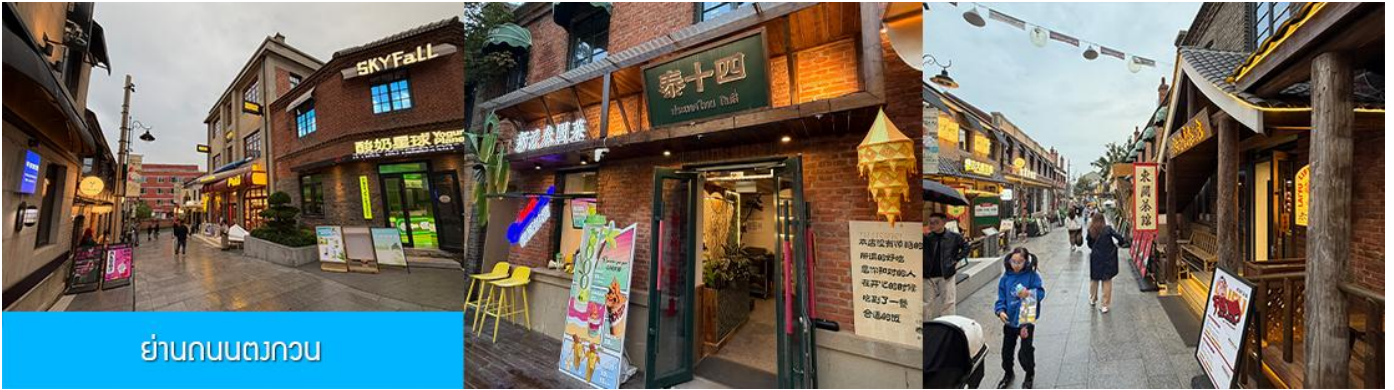
ย่านถนนตวงกวน

นำท่านเที่ยวชม จัตุรัสชิงไห่ 星海广场 เป็นจัตุรัสขนาดใหญ่เป็นแลนด์มาร์คสำคัญของเมืองต้าเหลียน สร้างขึ้นเพื่อเฉลิมฉลองในโอกาสที่รัฐบาลอังกฤษคืนเกาะฮ่องกงในให้จีนในปี ค.ศ. 1997 ตั้งอยู่ชายฝั่งทะเลในเมืองต้าเหลียน เป็นจัตุรัสใจกลางเมืองที่ใหญ่ที่สุดในโลกและ เป็นแลนด์มาร์คของเมืองต้าเหลียน รายล้อมด้วยตึกกระจาที่ทันสมัย ภายในมีบ่อน้ำพุดนตรี ลานหญ้าขนาดใหญ่ และลานกว้างสำหรับจัดกิจกรรมกลางแจ้ง อาทิ เทศกาลเบียร์นานาชาติ การแข่งขันวิ่งมาราธอน งานแฟชั่นนานาชาติเมืองต้าเหลียน ฯลฯ