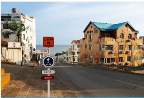
ถนนคอบเพลิงหมายเลข 8

นำท่านชมสวนสาธารณะเว่ยไห่ 威海公园 สวนสาธารณะริมทะเลที่ใหญ่ที่สุดของเมืองเว่ยไห่ ให้ท่านชมและถ่ายภาพคู่กับ กรอบรูปยักษ์วิวทะเล 威海公园大相框 แลนด์มาร์คที่เป็นอีกหนึ่งไฮไลท์สุดฮิตของเว่ยไห่