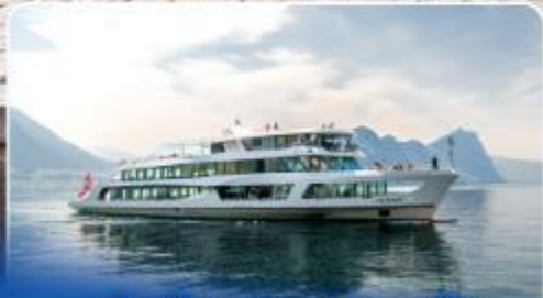
ล่องเรือทานอาหารกลางวัน ทะเลสาบลูเซิร์น