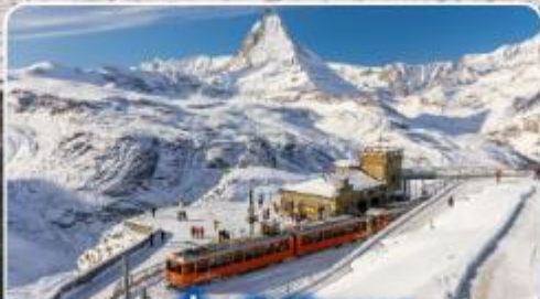
นั่งรถไฟสุดอลเวง กรอนเนอร์เกรต