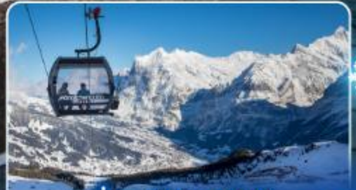
นั่งกระเช้าและรถไฟสุด อลเวงจากุงเฟรา