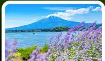
สวนโอะอิชิ พาร์ค