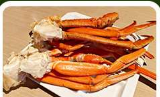
เมนูพิเศษ! ซาซิมิ

เกาะเอโนะชิมะ วิวสวยงามติด 1 ใน 100 ภูมิทัศน์ญี่ปุ่น พร้อมขอพรศาลเจ้าศักดิ์สิทธิ์ เที่ยวเต็มทั้ง 3 วัน แบบจุใจ ทั้งวัด ศาลเจ้า สวนดอกไม้ และช้อปปิ้ง