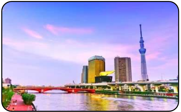
แม่น้ำสุมิตะ

สักการะ วัดมัตสึจิยามะโชเต็น หรือ “วัดหัวไชเท้า” ซึ่งเป็นวัดเก่าแก่ในย่านอาซากุสะ เป็นวัดเก่าแก่ในย่านอาซากุสะ กรุงโตเกียว ตั้งอยู่บนเนินเขาเล็ก ๆ ริมแม่น้ำสุมิตะ จุดเด่นคือเป็นวัดที่ขึ้นชื่อเรื่อง “ขอพรด้านการเงิน” โชคลาภ และความสำเร็จในธุรกิจ ส่วนไฮไลต์สำคัญของวัดนี้คือ ไคคอน หรือหัวไชเท้า สัญลักษณ์ศักดิ์สิทธิ์ คนที่นี้เชื่อว่าไคคอนช่วย “ชำระล้างสิ่งไม่ดี” และนำโชคลาภเข้ามา นักท่องเที่ยวมักนำไคคอนไปถวายเพื่อขอพร