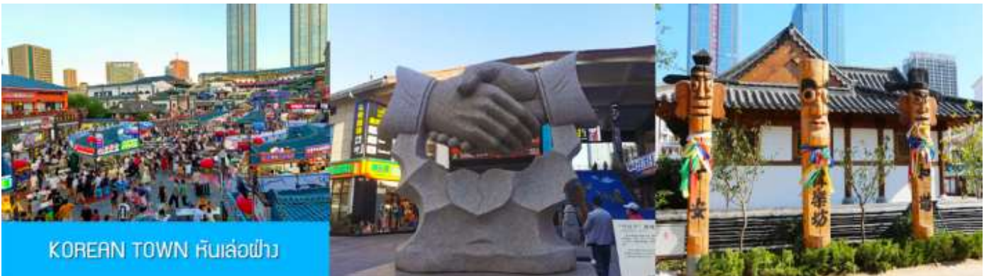
KOREAN TOWN หันเล่อฝาง