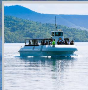
"LAKE SHIKOTSU GLASS BOAT"