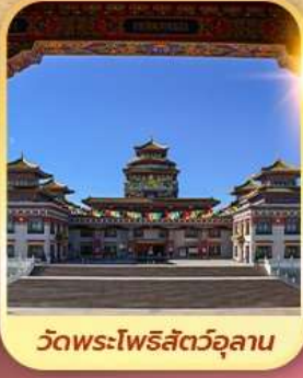
วัดพระโพธิสัตว์อูลาน