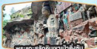
พระแกะสลักหินเจ้าป่าตั้งฉิน