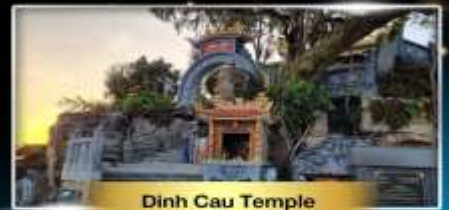
Dinh Cau Temple