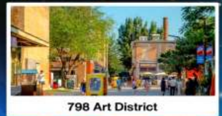
798 Art District