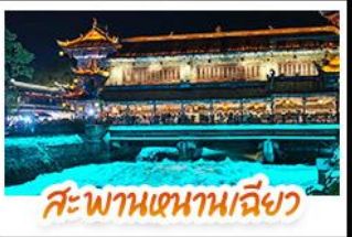
สะพานเทพานเฉียว