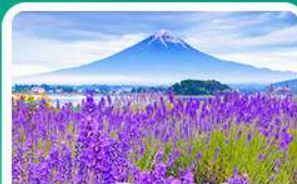
สวนโออิชิปาร์ก