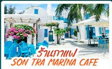
ร้านอาหาร SON TRA MARINA CAFE