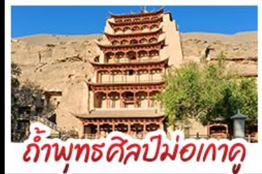
กำแพงพุทธศิลป์ม่อเถา

เป็นทรายครวญ - สระน้ำวังพระจันทร์ ทะเลสาบเกลือฉ่าซ่า - กำพุทธรศิลป์ม่อเถา หุบเขาสายรุ้งจางเย่ - ทะเลสาบซิงไห่