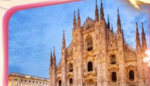
คูโอโมมิลาโน