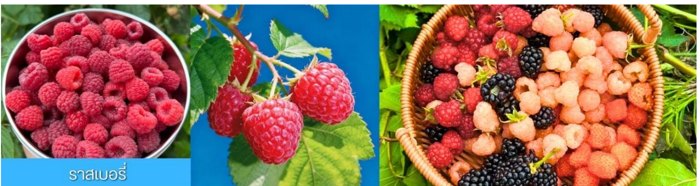
ราสเบอร์รี่