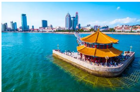
สะพานจ้านเฉียว