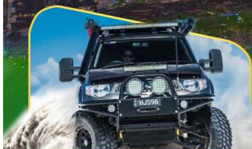
ขึ้นรถ 4WD สู้อีกกลางเทือกเขาคอเคซัส