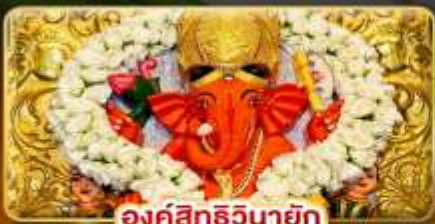
องค์สิทธินายัก