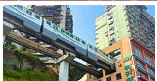
รถไฟทะลุคัต