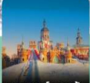
คฤหาสน์วอลก้า