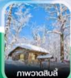
ภาพวาดสีบลู