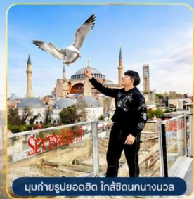
มุขถ่ายรูปยอดฮิต โกลีฮัดนทงนงวอล