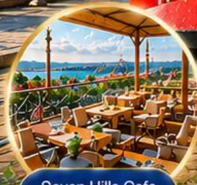
Seven Hills Cafe ชมวิว อิสตันบูล