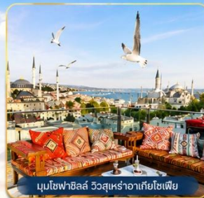
มุขโหลยาลึล วูลสุหร่าฮาเกียโซเฟีย

ช่องแคบบอสฟอรัส • สุเหร่าสีน้ำเงิน • สุเหร่าฮาเกียโซเฟีย