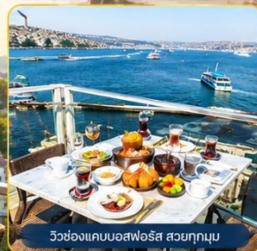
วูลซอกแคบบอสฟอรัส สวดยทุกมุข