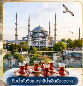
ต้นด่ากับวูลสุหร่าสีน้ำเงินฮัดนทงนงวอล

พิเศษ...สุดๆ! นำท่าน ขึ้นสู่จุดเช็คอินแห่งใหม่ Seven Hills Café ซึ่งเป็นสถานที่ยอดนิยมขณะนี้..บนชั้นดาดฟ้า ของโรงแรมเซเวนฮิลล์ส ท่านจะได้ถ่ายรูปกับวิวมุมต่าง ๆ ช่องแคบบอสฟอรัส, สุเหร่าสีน้ำเงินและสุเหร่าฮาเกียโซเฟีย พร้อม ให้อาหาร กับเหล่านกนางนวลที่จะบินมารับอาหารจากท่าน **ขออนุญาตท่านที่ชื่นชมความงามวิวกว้อยล้ำ ช่วยอุดหนุนเครื่องดื่ม ชา กาแฟ ซอฟดริงค์ อื่นๆ ตามต้องการ