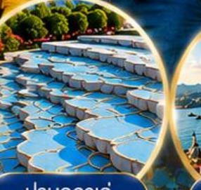
ปานุกคาล์ Pamukkale