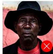
Back side is colored