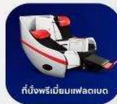
ที่นั่งพรีเมียมแพลนเน็ต