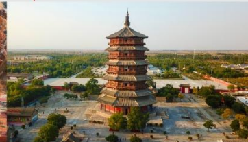
วัดเจดีย์ไม้ มู่ต้า

*ทางบริษัทฯ ขอสงวนสิทธิ์ในการสลับโปรแกรมทัวร์ตามความเหมาะสมขึ้นอยู่กับสถานการณ์หน้างาน โดยคำนึงถึงผลประโยชน์ของลูกค้าเป็นสำคัญ