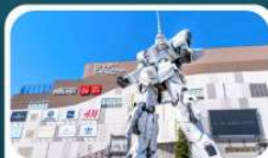
ห้างโตเวอร์ซิตี