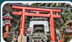
ศาลเจ้าอะชิมะ