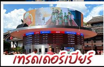
เกรตเตอร์เบียร์