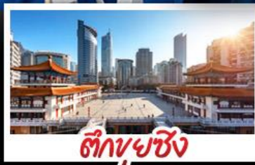
ตึกพวยซิง