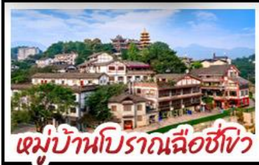
หมู่บ้านโบราณฉือซิง

พระเอกสลักหินตัวจู้ - ตึกตะเกียบ Raffles City - ตึกพวยซิง เกรตเตอร์เบียร์ - หมู่บ้านโบราณฉือซิง