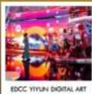
EDCC YIYUN DIGITAL ART