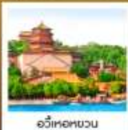
อวี่เหอหยวน

เปิดปักกิ่ง / สุกี่มองโกล มิซซอซิน TAO TAO JU