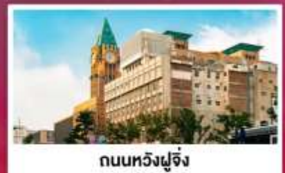
ถนนหวังฝูจิ่ง