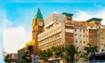
ถนนหวังฝูจิ่ง