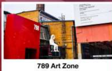
798 Art Zone