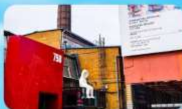
798 Art Zone