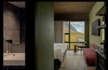
HÓTEL JÖKULSARLON - GLACIER LAGOON HOTEL