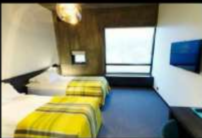
FOSSHOTEL GLACIER LAGOON