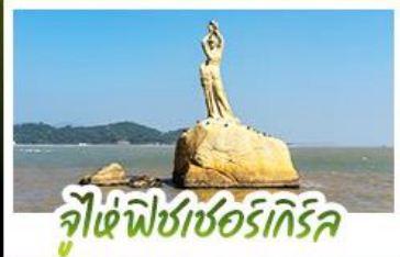
จูไห่ฟิชเชอร์เกิร์ล

ดื่มคำบรรยายาศศคคาสลิสไลต์อังกฤษ ณ THE LONDONER MACAO ไหว้พระ-ตั้ง 3 วัดตั้ง ขอพรการทำงาน การเงิน ความรัก ครอบงมในรูปเดียว ชมความวิจิตรตระการตาของพระ-ราชวังหยวนหมิงหยวนใหม่แห่งจูไห่ ช้อปปิ้งจุใจ ย่านจิมซาจุ้ยและถนนคนเดินฟู้ทวอลล์