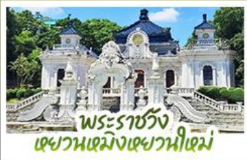
พระ-ราชวัง เซวามเซมิงเซวานีเซม