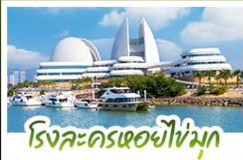
โรงละครเซอซิมูค