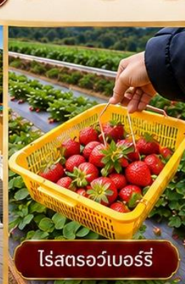
ไร่สตอร์เบอร์รี่