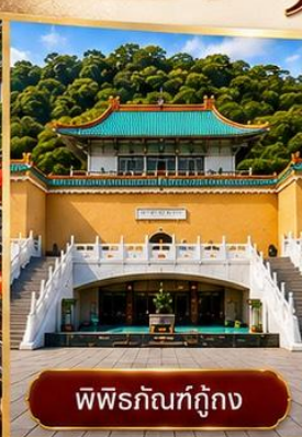
พิพิธภัณฑ์กู่กง