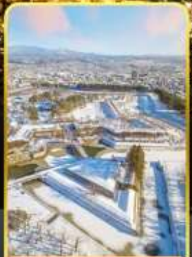
หอดาวห้าแฉก