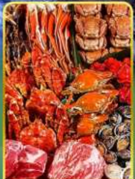
ปิ้งย่างพรีเมียมมันตะ