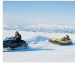
กิจกรรมบีโบสโนว์แลนด์