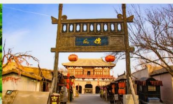
เมืองโบราณตุนหวง